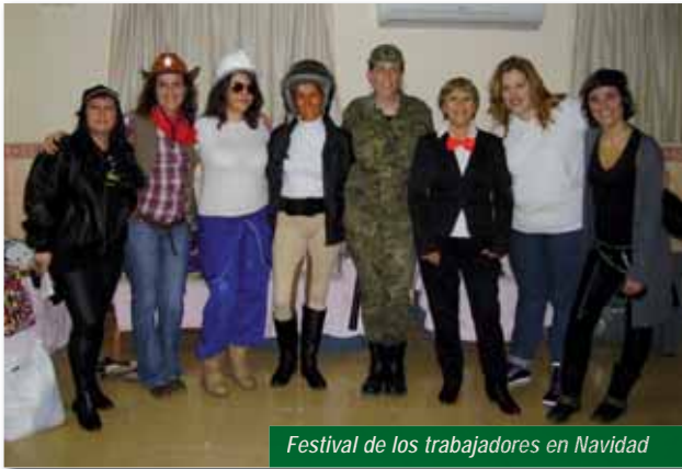
Festival de los trabajadores en Navidad