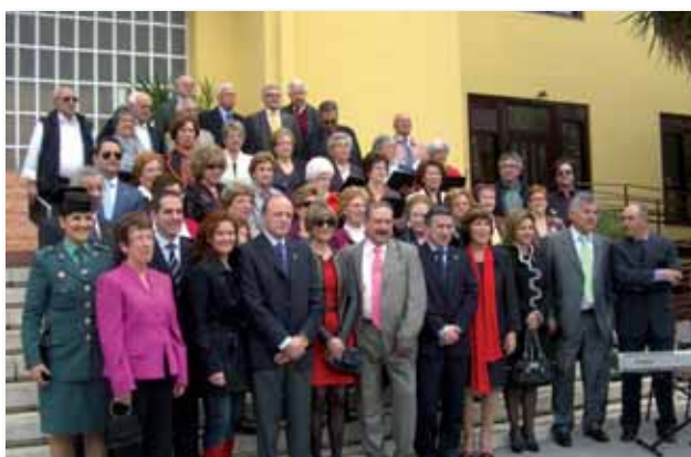
Coro y autoridades asistentes