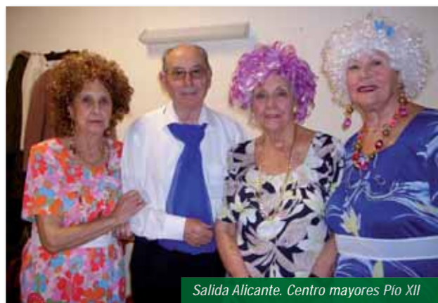
Salida Alicante. Centro mayores Pío XII

• Colaboración en la actuación especial navideña del CEAM Pío XII de Alicante. Invitaron a tres residentas para que representaran las actuaciones de Tricicle y La Trinca que habían preparado en el espectáculo de San José 2011.