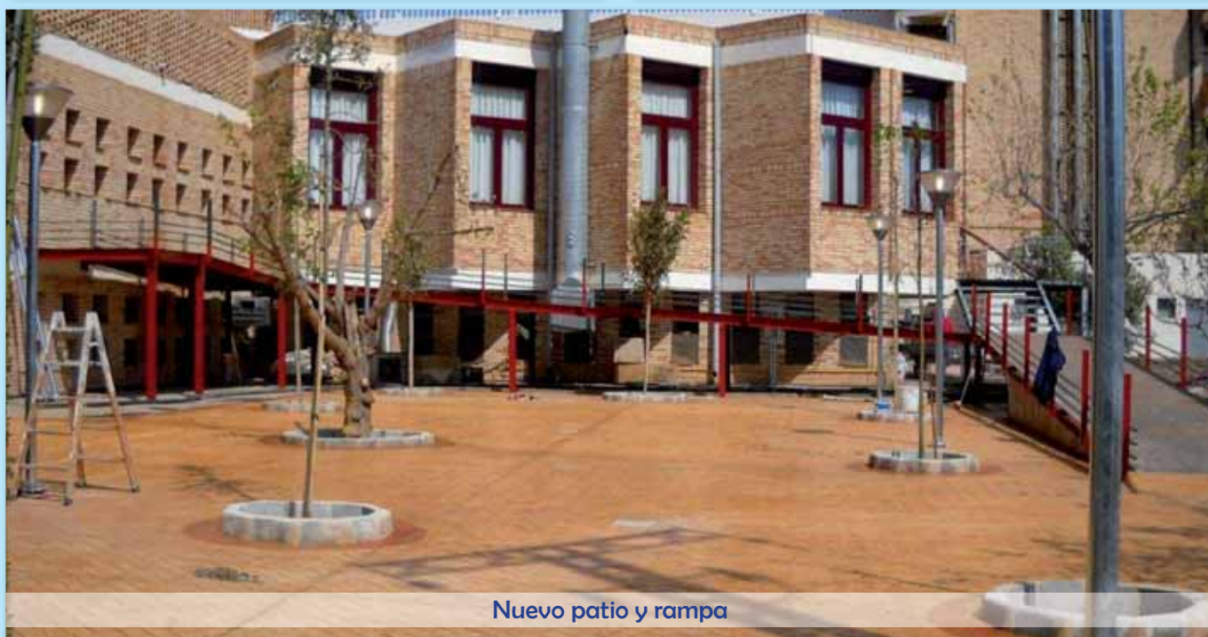
Nuevo patio y rampa