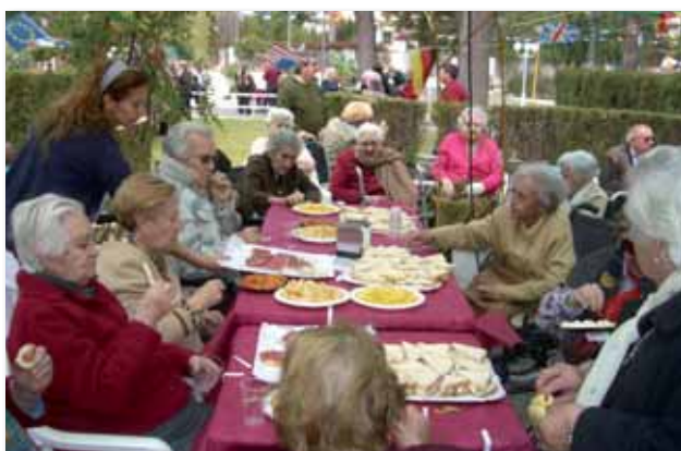
Residentes en el cocktail

Lamentablemente todo el equipo municipal por compromisos de agenda abandono la residencia, deseándonos éxito en nuestra gestión y su apoyo municipal.