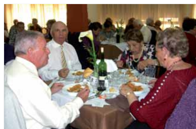
Comensales en la comida especial