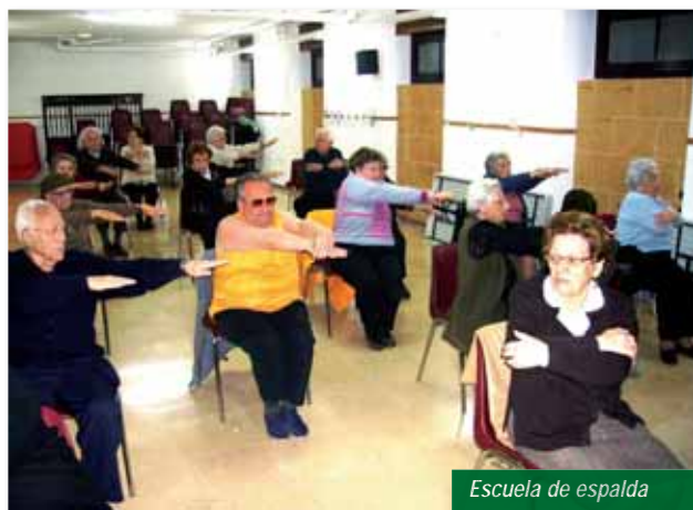
Escuela de espalda