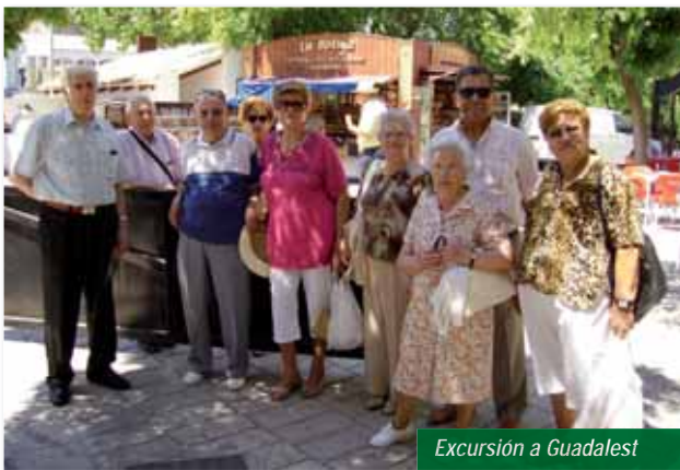
Excursión a Guadalest