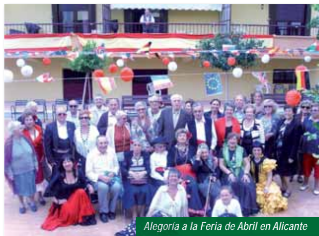
Alegoría a la Feria de Abril en Alicante

• Feria de Abril, para el que se preparó un taller de sevillanas, algunas de nuestras residentas se hicieron trajes y decoramos nuestra entrada principal como un auténtico patio andaluz. El día de la feria nos acompañó el grupo de sevillanas del Casal de la 3ª Edad de San Juan.