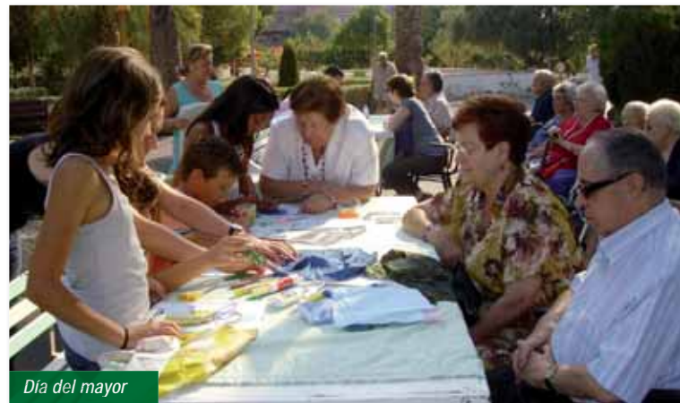
Día del mayor