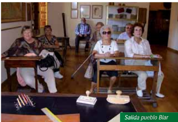
Salida pueblo Biar