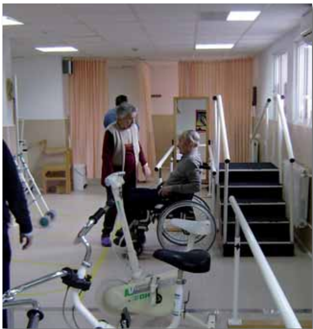
Esposa y asistido en rehabilitación