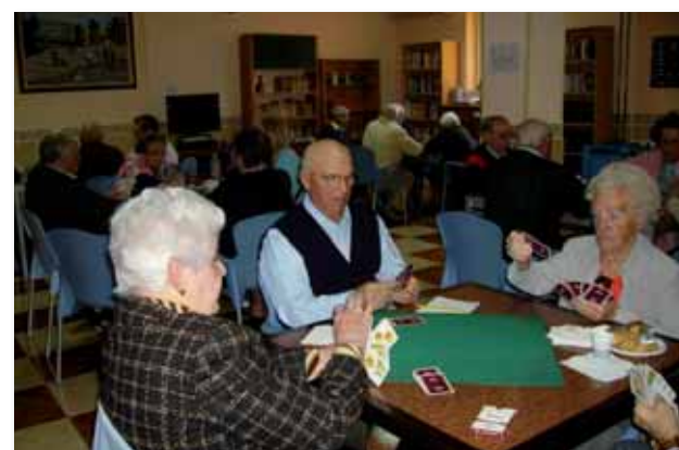
Torneo de juegos de mesa