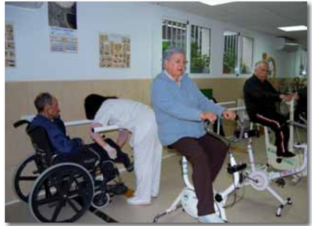
Residentes en rehabilitación

Al entrar un residente nuevo, todos los profesionales lo valoramos en todos sus aspectos y le hacemos un seguimiento durante un tiempo para ver si está bien ubicado en nuestros protocolos. (válidos, semi asistidos y asistidos)