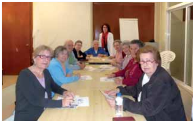
Grupo de estimulación mental

A los de nivel leve y moderado, entre la animadora sociocultural, la fisioterapeuta y yo misma, diariamente les hacemos psicoestimulación y psicomotricidad.