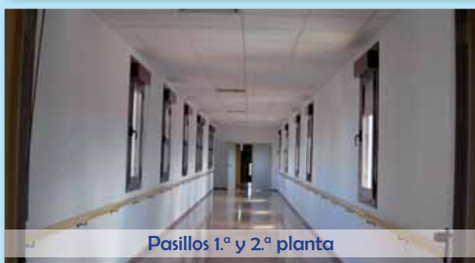
Pasillos 1.ª y 2.ª planta