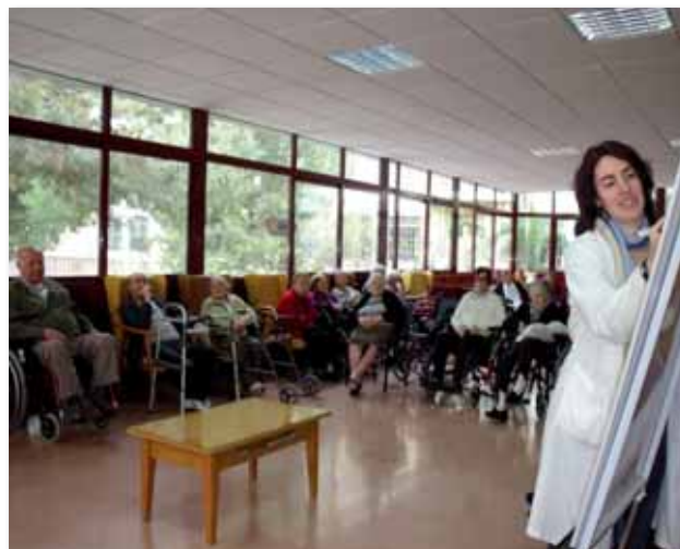
Residentes en psicoestimulación

Mi labor sobre todo es, primero de prevención, o sea darme cuenta que para ellos existe un problema e intentar atajarlo antes de que vaya a más. Comunicarle a los compañeros para que tengamos claros los conceptos, porque algún auxiliar ve alguien mal y puede