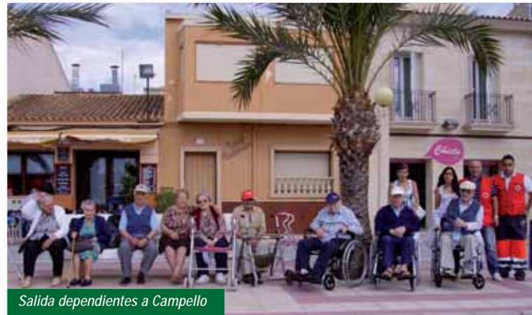
Salida dependientes a Campello