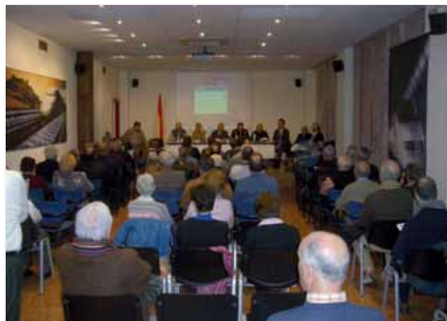
Asistentes a la Junta General