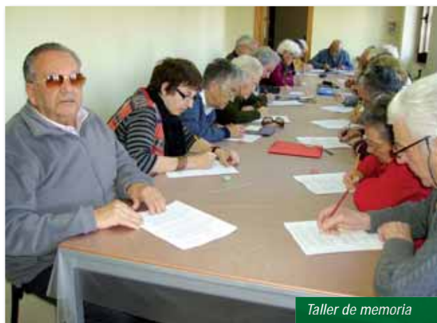
Taller de memoria