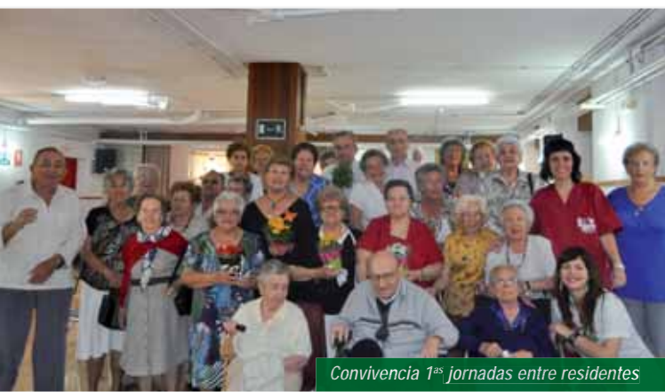
Convivencia 1ªs jornadas entre residentes

⇒ Con familiares: Jornadas con residentes y sus familiares. Enfocadas a un grupo de residentes con problemas a nivel familiar y de posible aislamiento/soledad. Se llevó a cabo en una granja escuela, con la visita guiada, viendo animales e interactuando con ellos. Se realizaron talleres de manualidades y cocina, entre ellos arcilla, confección de agendas y elaboración de rosquillas. Ha sido una gran experiencia para todos, gratificante y en algunos casos ha mejorado su situación familiar.