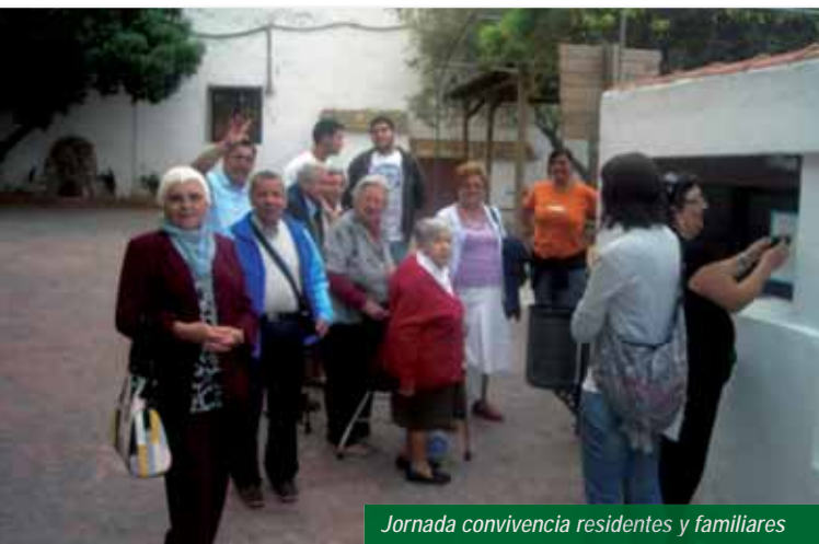
Jornada convivencia residentes y familiares

⇒ Con residentes: Jornada “No te rindas”. Por la mañana un grupo de residentes dieron una charla a sus compañeros sobre la importancia de mantener un pensamiento positivo ante situaciones personales difíciles. Por la tarde y para clausurar la jornada, se realizó un taller gastronómico para todos los participantes.