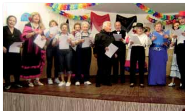
Escenas del teatro y fin de fiesta

Esperamos que con estos breves comentarios y las imágenes gráficas que os presentamos podáis haceros una idea de los felices que hicimos a nuestros mayores en SU DIA, nuestro principal objetivo.