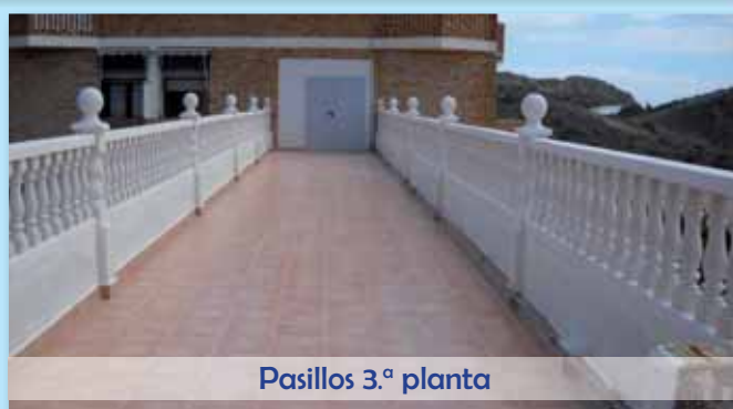
Pasillos 3.ª planta