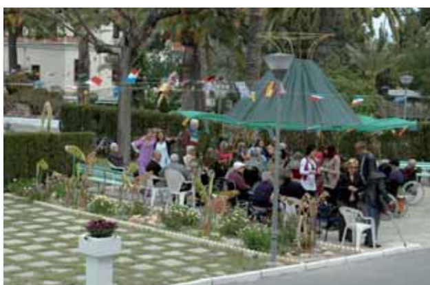
Coctail en la carpa

A continuación la Dirección del Centro ofreció en los jardines de la Residencia un aperitivo para los residentes y asistentes en general que como siempre fue abundante, surtido y de magnífica calidad.