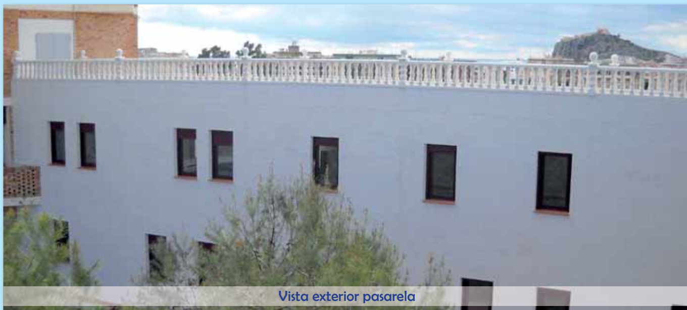
Vista exterior pasarela