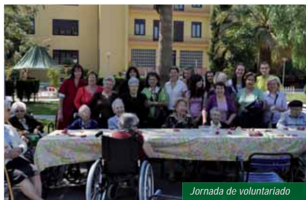
Jornada de voluntariado

• Jornada de Voluntariado, donde invitamos a La Asociación de Mujeres Víctimas de la Violencia de Género y a Universitarios para conocer nuestras instalaciones, realizar actividades con nuestros residentes y ofrecer la posibilidad de colaborar con nosotros de voluntarios.