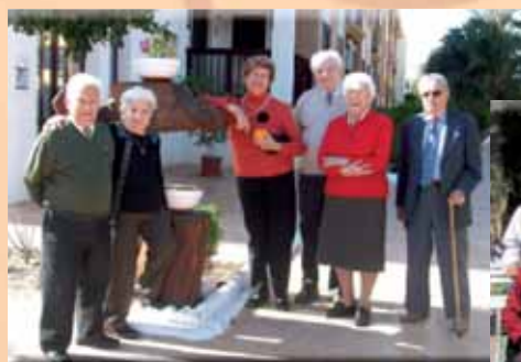
Residentes San Juan