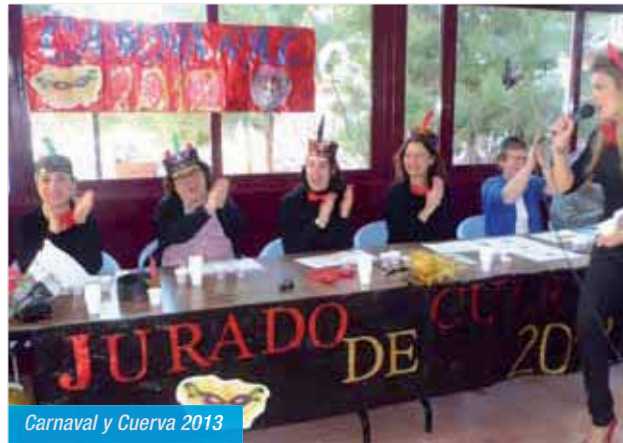
Carnaval y Cuerva 2013

que puso en serios aprietos al jurado que tuvo que dilucidar el reparto de premios en el que recibieron sus correspondientes diplomas. Después se compartió un estupendo aperitivo.