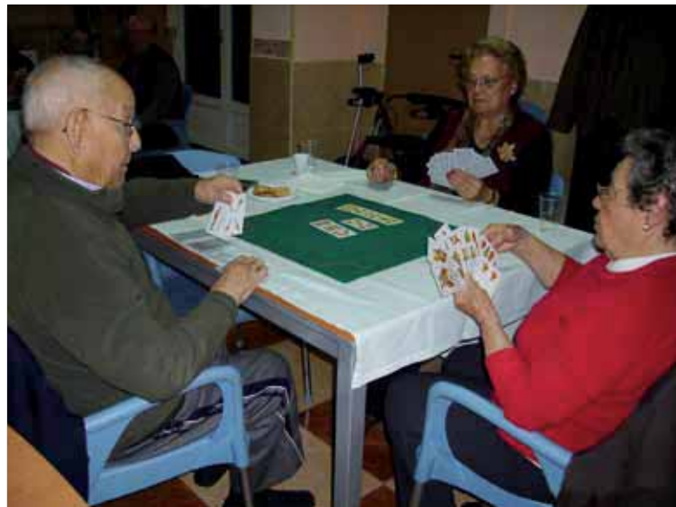
Campeonato del cinquillo

También y previo al Día del residente, durante la semana del 11 al 15 se realizaron diferentes actuaciones que contaron con la