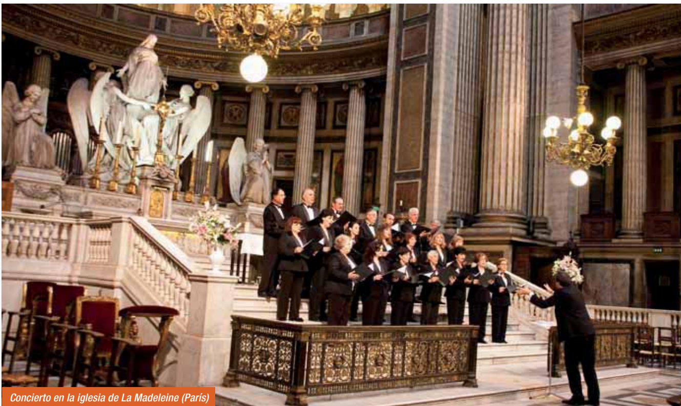
Concierto en la iglesia de La Madeleine (París)