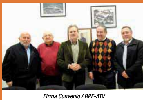
Firma Convenio ARPF-ATV