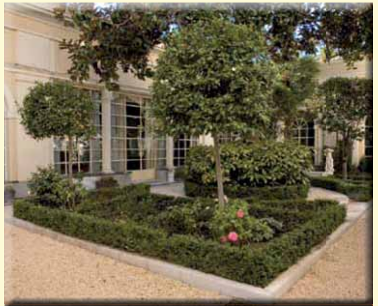
Jardines del Palacio