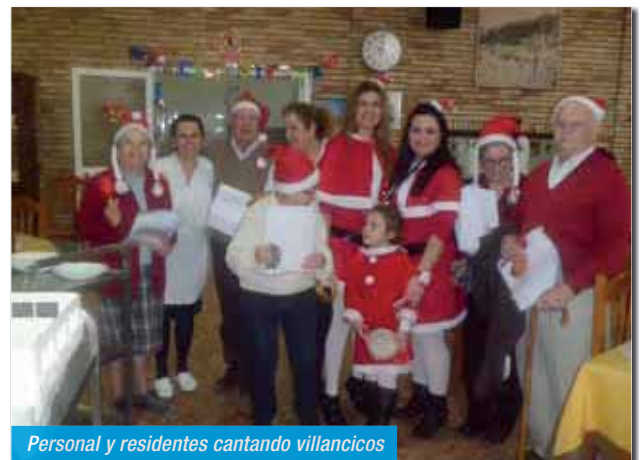
Personal y residentes cantando villancicos