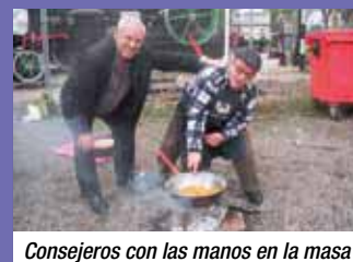
Consejeros con las manos en la masa