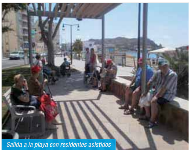
Salida a la playa con residentes asistidos

También fue interesante el CONCURSO DE DISFRACES, realizados todos ellos en el taller de Manualidades del departamento de Animación. Nuestros residentes desfilaron con ellos, esta vez acompañados por la asociación AFEMAC de Águilas, a la que invitamos previamente y que participó con 20 personas igualmente disfrazadas. Fue un desfile de altura