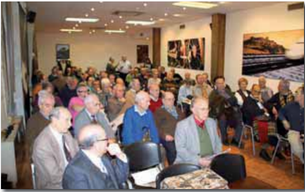
Asistentes a la Junta General