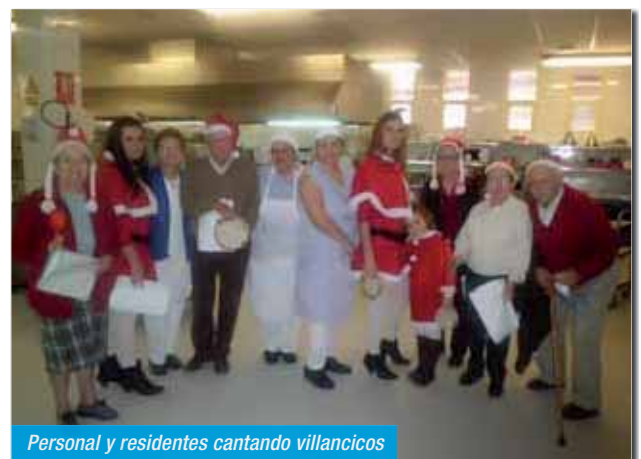
Personal y residentes cantando villancicos

En NOCHEBUENA, como cada año, por la mañana nos regaló un magnífico recital LA BANDA DEL PATRONATO MUNICIPAL DE ÁGUILAS.