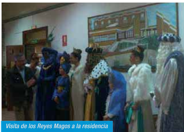
Visita de los Reyes Magos a la residencia

En NOCHEBUENA, como cada año, por la mañana nos regaló un magnífico recital LA BANDA DEL PATRONATO MUNICIPAL DE ÁGUILAS.