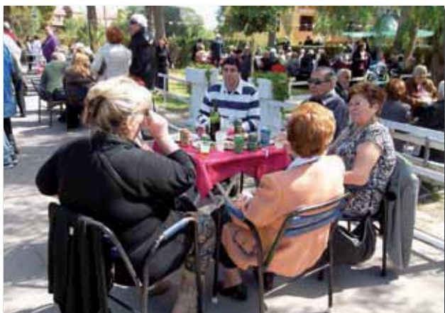
Cocktail en los jardines de la residencia

Previo al almuerzo se sirvió un aperitivo en el jardín y al final del mismo parte de las personalidades asistentes se despidieron, agradeciéndonos nuestra deferencia hacia ellos.