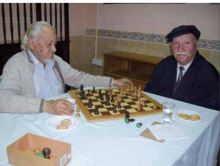
Campeonato de ajedrez