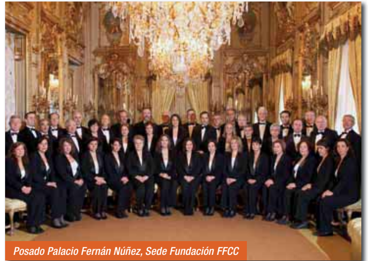
Posado Palacio Fernán Núñez, Sede Fundación FFCC

De las más de 150 actuaciones ofrecidas dentro y fuera de nuestro país, podemos destacar la Misa en la Basílica de San Pedro del Vaticano, Misas Conciertos en las Catedrales de Sevilla, Salamanca, Santiago de Compostela, Mezquita Catedral de Córdoba y Catedral de Granada. Conciertos en el Panteón de Agripa y Plaza de España (Roma), Catedral de Notre Dame e Iglesia de la Madeleine (París), Auditorio Nacional y, más recientemente, Concierto de Navidad ofrecido en la Iglesia de Santa Teresa de Ávila en Budapest (Hungria) y posterior actuación en la Embajada de España en dicha capital.