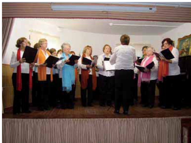
Coral de mujeres de la Asociación Área 18