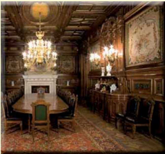
Salón-comedor del Palacio