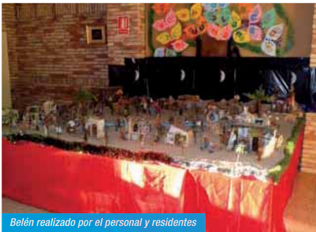
Belén realizado por el personal y residentes

El día 27 los niños SCOUT de Águilas nos visitaron ofreciéndonos un estupendo recital de villancicos, y el día de reyes sus Majestades visitaron a nuestros residentes.