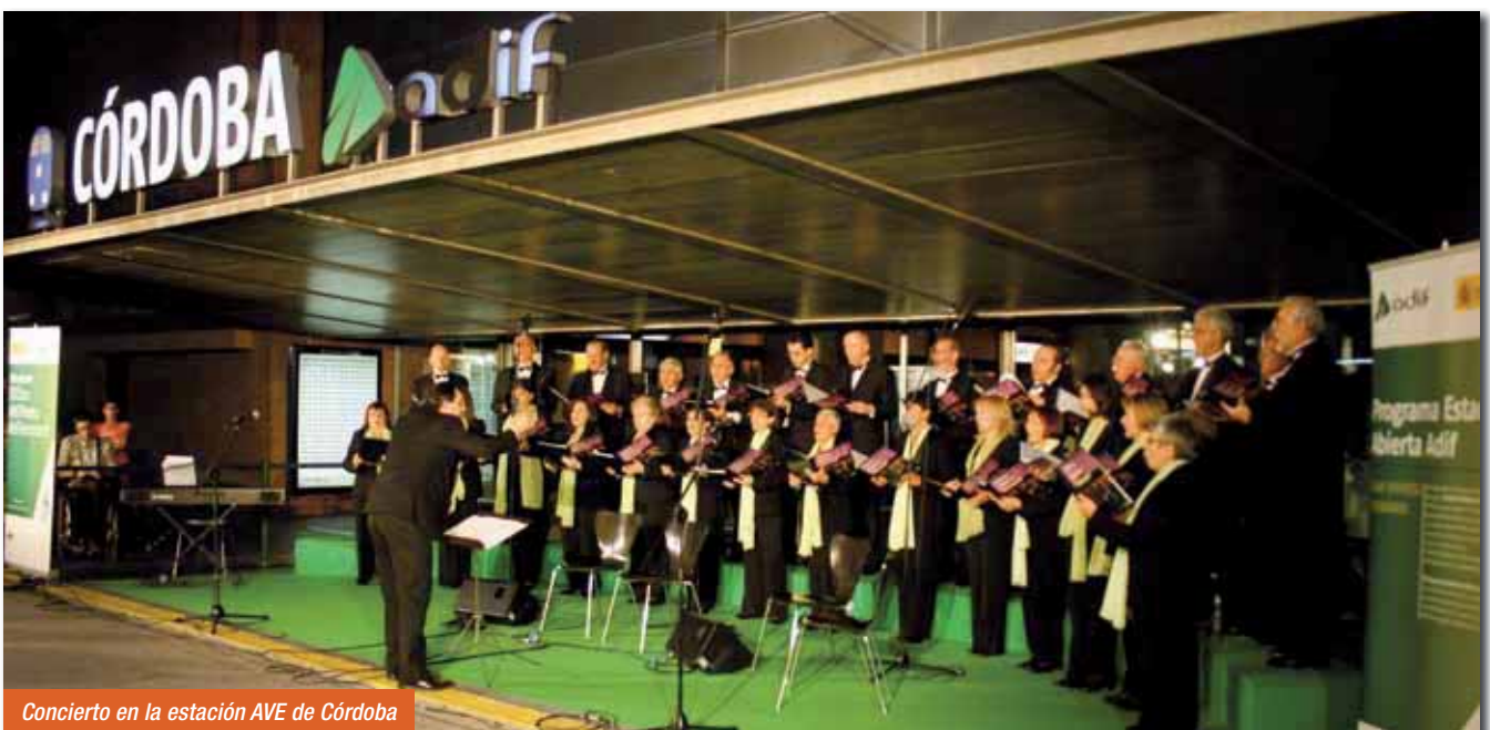
Concierto en la estación AVE de Córdoba

El Coro tiene como objetivo el disfrute de sus componentes en el ejercicio de la música y un compromiso decidido de mejora de sus niveles de calidad para, de esta manera, dar cumplida respuesta a las expectativas del público.