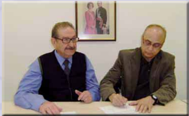
Firma Convenio AMPE-ARPF