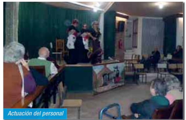
Actuación del personal

El MARTES junto a la Residencia de San Francisco y la Asociación de Alzheimer de Águilas fuimos invitados a la proyección de la película "El ladrón de palabras" en los multicines del Hornillo. En agradecimiento les regalamos algunas manualidades realizadas en los diferentes talleres de la Residencia.