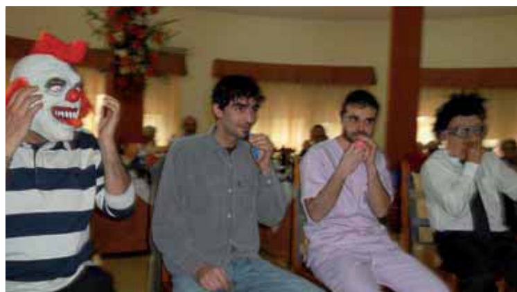
Trucos con asistentes con disfraz