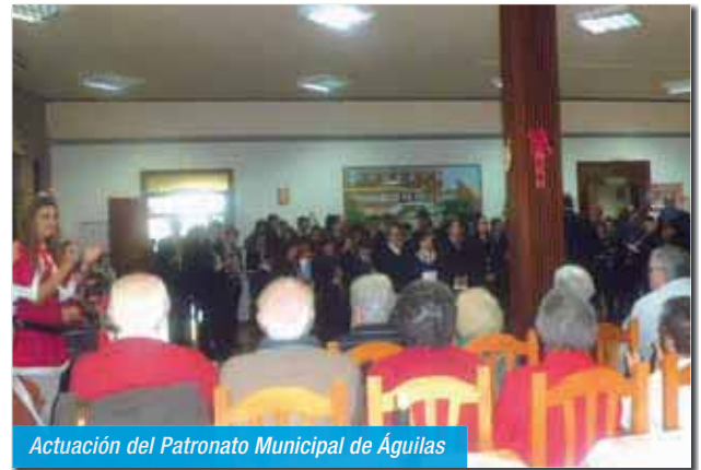
Actuación del Patronato Municipal de Águilas

Y llegó la NAVIDAD, y como es habitual antes de Noche Buena los residentes que realizaron los adornos navideños y los participantes en el coro fueron agasajados con un chocolate y pastas por parte del departamento de Animación.