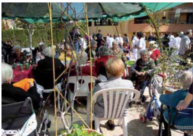
Cocktail en los jardines

Al finalizar el almuerzo, con la sobremesa que amenizó el postre el "MAGO CHARLY" gran showman, del cual disfrutaron todos los asistentes con sus trucos de magia y sentido del humor.