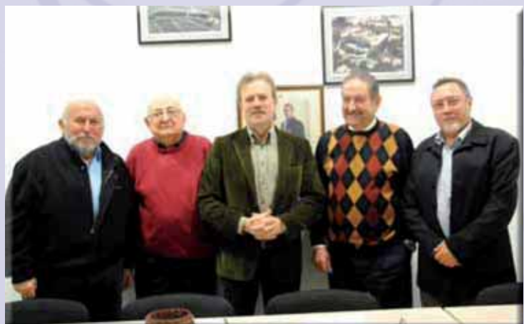
Firma Convenio ARPF-ATV