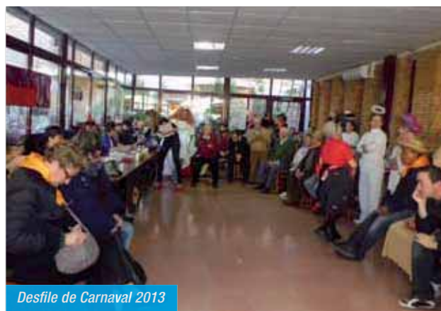
Desfile de Carnaval 2013

que puso en serios aprietos al jurado que tuvo que dilucidar el reparto de premios en el que recibieron sus correspondientes diplomas. Después se compartió un estupendo aperitivo.