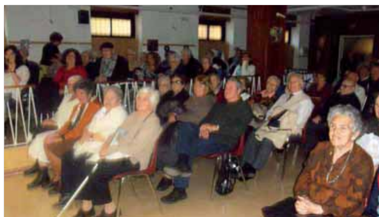
Residentes asistentes a la sesión teatral