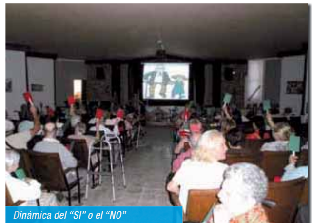
Dinámica del "SI" o el "NO"

El JUEVES nos desplazamos a la Residencia de San Francisco para jugar con ellos un BINGO en el que los premios a la línea y al bingo eran regalos de referencia de la Residencia de San Francisco.