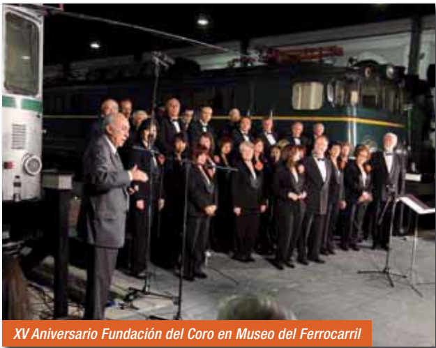
XV Aniversario Fundación del Coro en Museo del Ferrocarril

Respecto a proyectos, tiene, entre otros, la realización de un viaje a Bruselas para ofrecer un concierto en el Auditorio Jehudi Menuhin del Parlamento Europeo, así como una Misa Concierto en la Catedral de Gante (Bélgica).