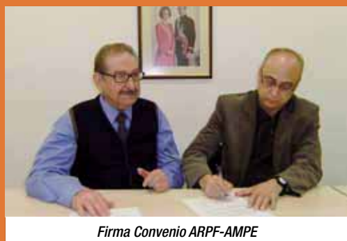
Firma Convenio ARPF-AMPE