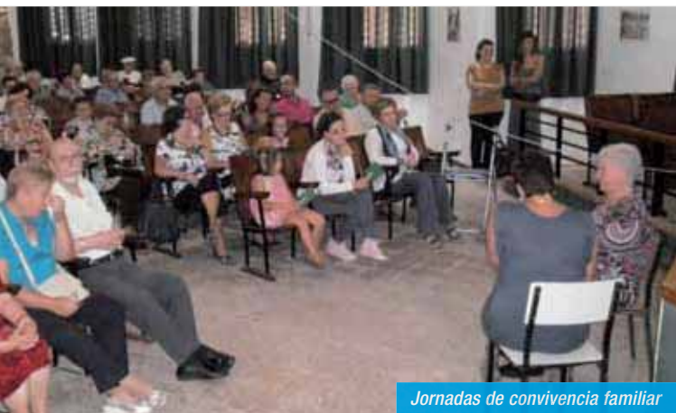
Jornadas de convivencia familiar

Posteriormente, se continuó con las actividades programadas para ese día, visitándose la Sala donde estaban expuestos