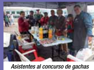
Asistentes al concurso de gachas

Desde estas líneas queremos hacerlos llegar a los asociados que para el próximo año, os pongáis en contacto con la Oficina Central a partir del mes de Octubre, para que os digamos la fecha de celebración del próximo concurso y al menos nos podáis acompañar en esta entrañable fiesta campera.