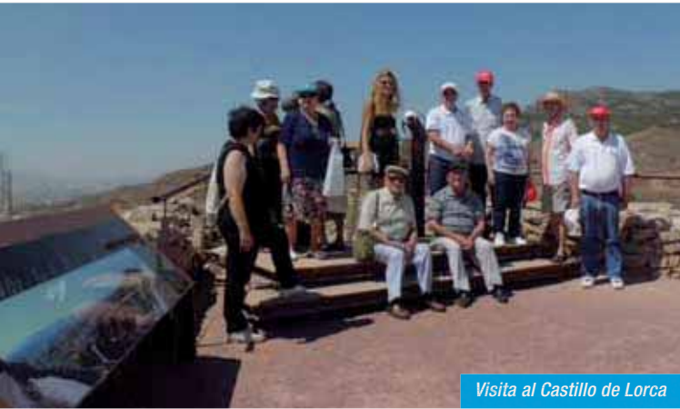
Visita al Castillo de Lorca

En Mayo pudimos admirar los valores y piezas únicas del MUSEO ARQUEOLÓGICO de Águilas. La exposición fotográfica y la muestra de artesanía del esparto con sus correspondientes explicaciones. Volvimos a la residencia no sin antes tomar una consumición en la Plaza de España.