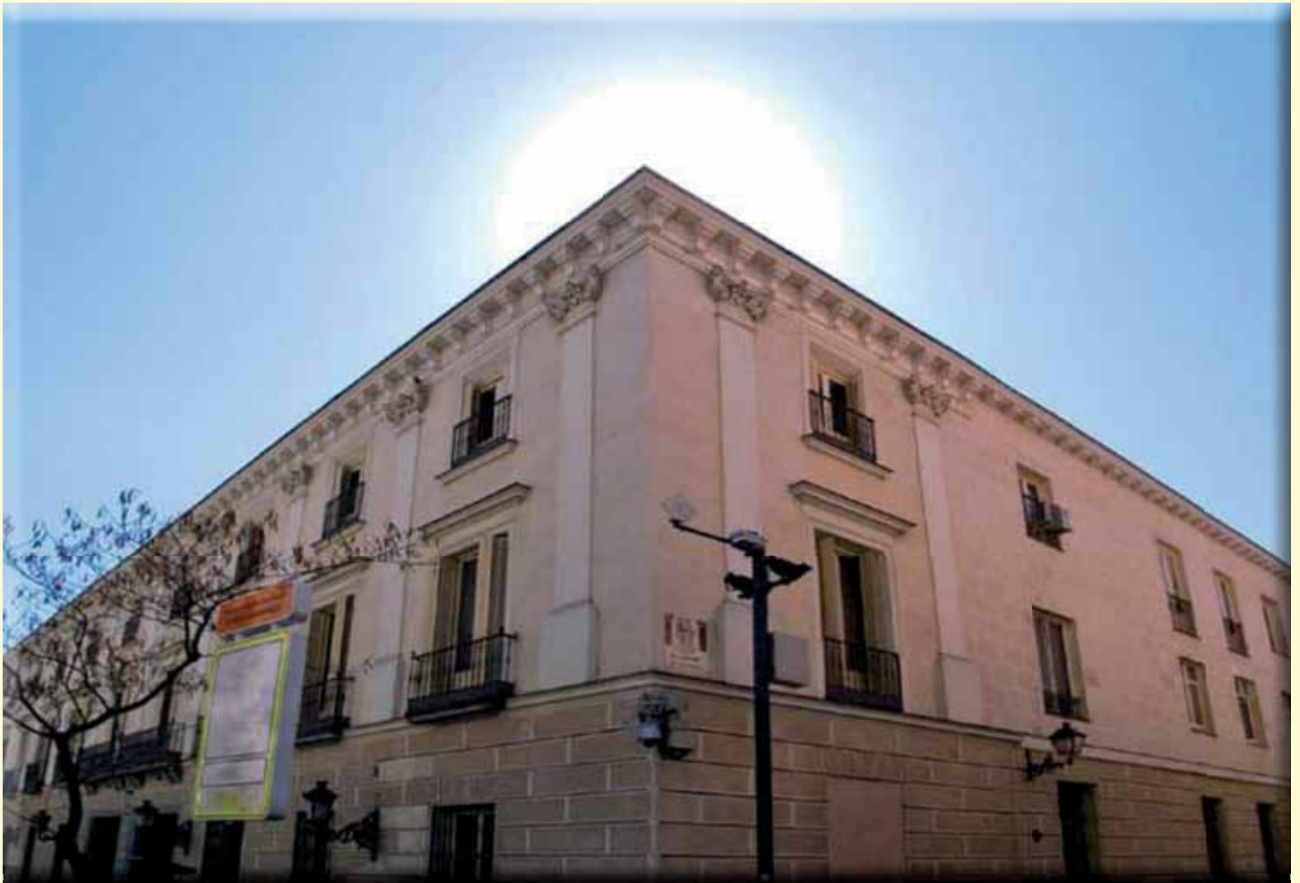
Palacio Fernán Núñez, sede de la Fundación FFCC