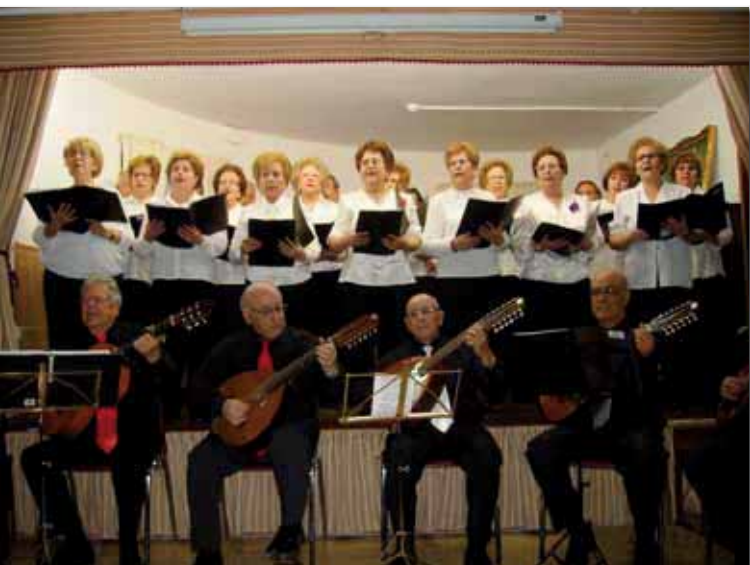
Coral-Rondalla UPD de Sax